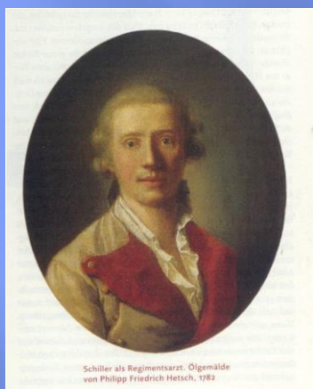
Schiller als Regimentsarzt. Ölgemälde von Philipp Friedrich Hetsch, 1782