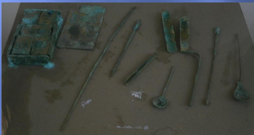
Instrumentos médicos romanos, Mérida